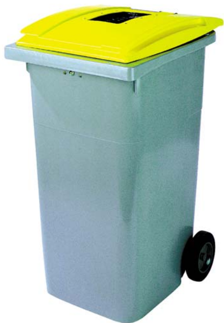
un bac habitat collectif

Pour les bouteilles en plastique, briques alimentaires, boîtes métalliques et cartonnettes