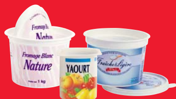
Pots de produits laitiers