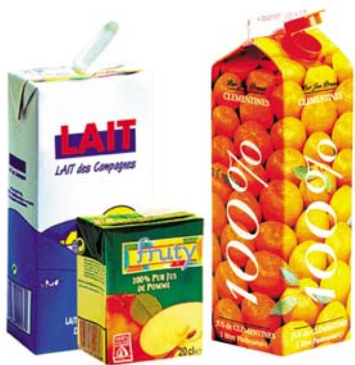
Les briques alimentaires

Vous les mettez en vrac et vides jaune ou le sac transparent