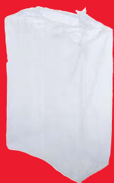
Films en plastique