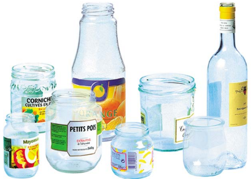
Les bocaux de conserve et les pots