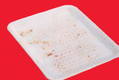
Barquettes en polystyrène