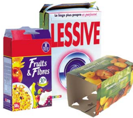
Les boîtes et les suremballages en cartons