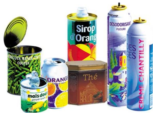
Les boîtes de conserve, les boîtes de boissons, les aérosols et les bidons