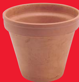
Pots de fleurs