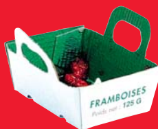
Boîtes en carton salies ou contenant des restes