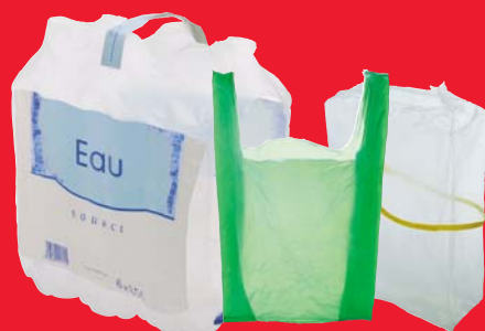
Suremballages, sacs, films en plastique