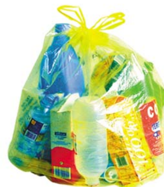
un sac habitat individuel

En fonction de votre habitation, vous disposez d'un bac à couvercle jaune collectif ou d'un sac transparent individuel. Il sera collecté à votre domicile. Pratique !