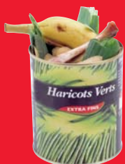
Boîtes contenant des restes