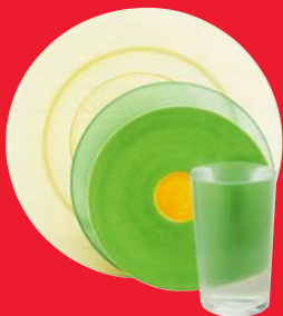
Vaisselle, faïence, porcelaine